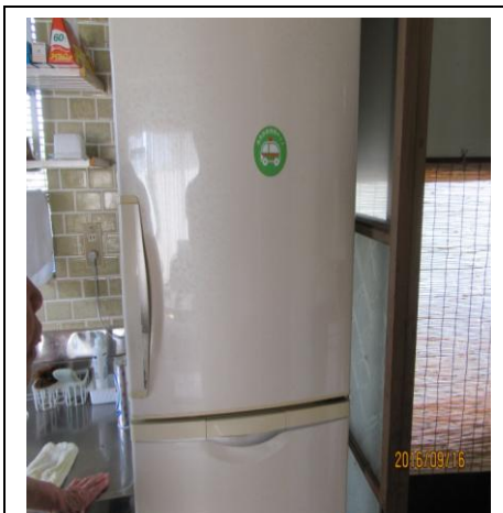
冷蔵庫に救急キット

普段からいざという時に備えて、電話の近くに「庄内町私の安心ネットワーク」を準備しておき、関係者にもその事を伝えておきましょう。貼るところがない場合は電話の下に置くなどすると無くならなくて良いようです。