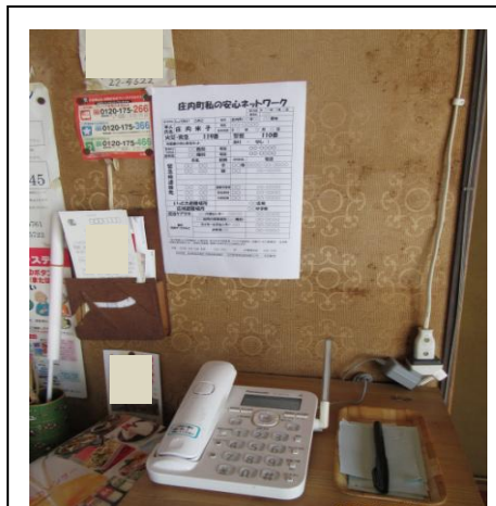
「庄内町私の安心ネットワーク」を電話の近くに準備